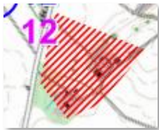
Eksempel på et skraveret område