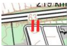
Eksempel på en vejspærring